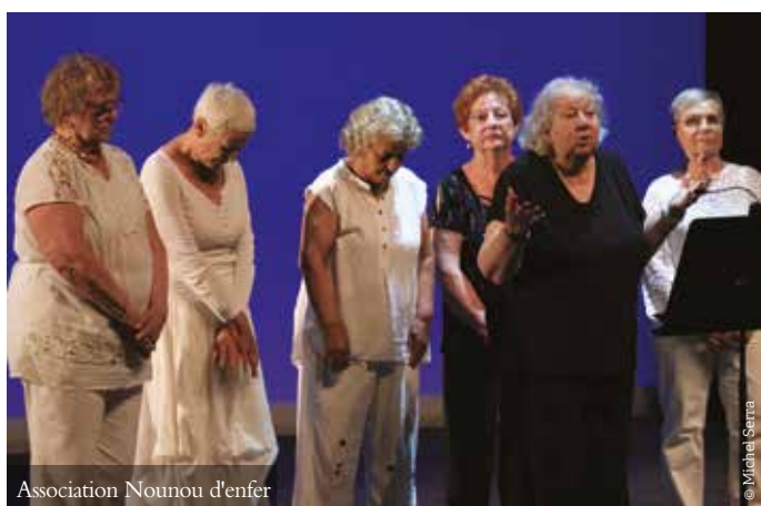
Association Nounou d'enfer